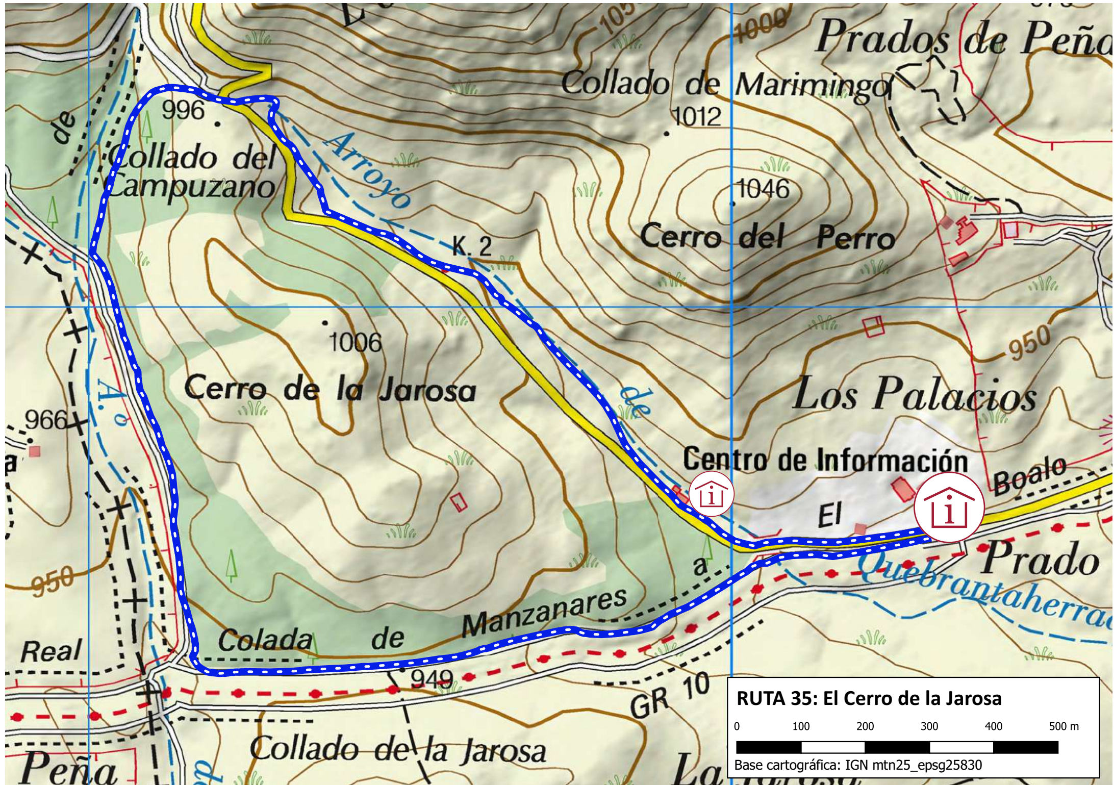
RUTA 35: El Cerro de la Jarosa 0 100 200 300 400 500 m Base cartográfica: IGN mtn25_epsg25830